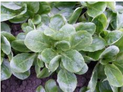
Abb. 6: Feldsalat 'Festival' (Hz)