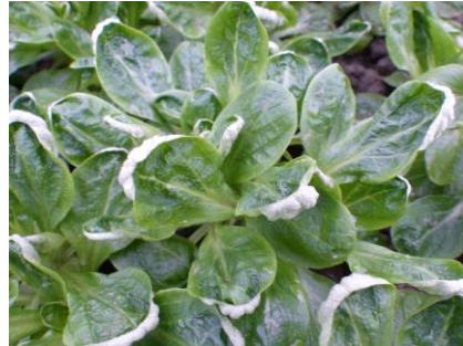
Abb. 3: Feldsalat 'Elan' (Bi)