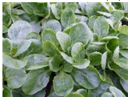
Abb. 9: Feldsalat 'Tauro' (RZ)