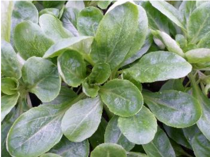
Abb. 2: Feldsalat 'Clarabelle' (Bi)