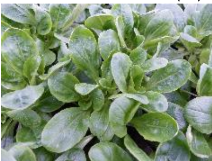
Abb. 8: Feldsalat 'Revelle' (RZ)