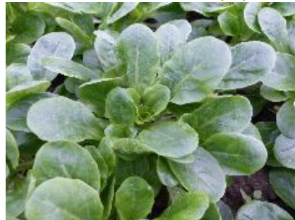
Abb. 5: Feldsalat 'Favor' (EZ)