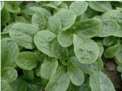
Abb. 4: Feldsalat 'Bonvita' (EZ)