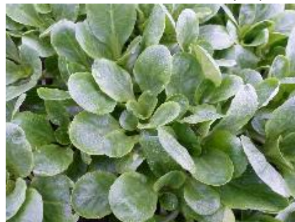
Abb. 7: Feldsalat 'Parade' (Hz)