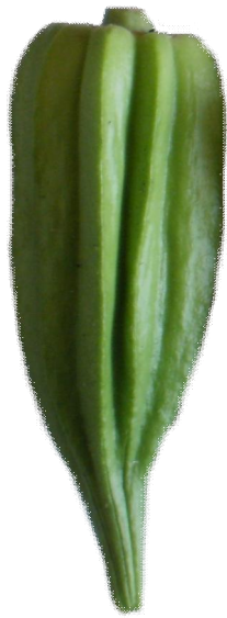
Star of David