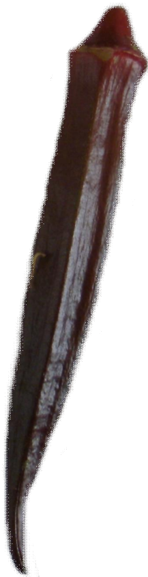
Rote Okra ,Bur- gundy