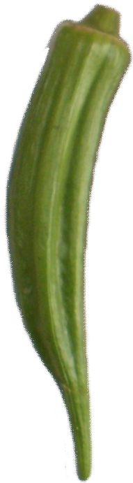
Dwarf Long Green Pod

Im Folgenden sind die einzelnen angebauten Okra-Sorten bildlich dargestellt.