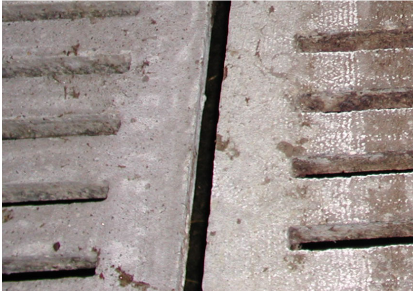
Abb. 1 Vergleich zwischen Säurebehandlung (l.) und Einsatz einer Fräse (r.), deutlich erkennbare Ausbrüche an der Kotabrisskante sind beim Fräsen kaum zu verhindern

Spaltenelemente bereits zu Auflösungserscheinungen kommen, durch die Rüttelbewegungen der Fräsmaschine können diese verstärkt werden, z.T. wurde das Ausbrechen von Beton und Freilegen der Armierungseisen beobachtet (Achtung: diese müssen von mind. 4 cm Beton überdeckt bleiben). Vollflächiges Fräsen wie Profilieren von Spaltenböden führt in der Regel zum Ausbrechen der Kotabrisskante.